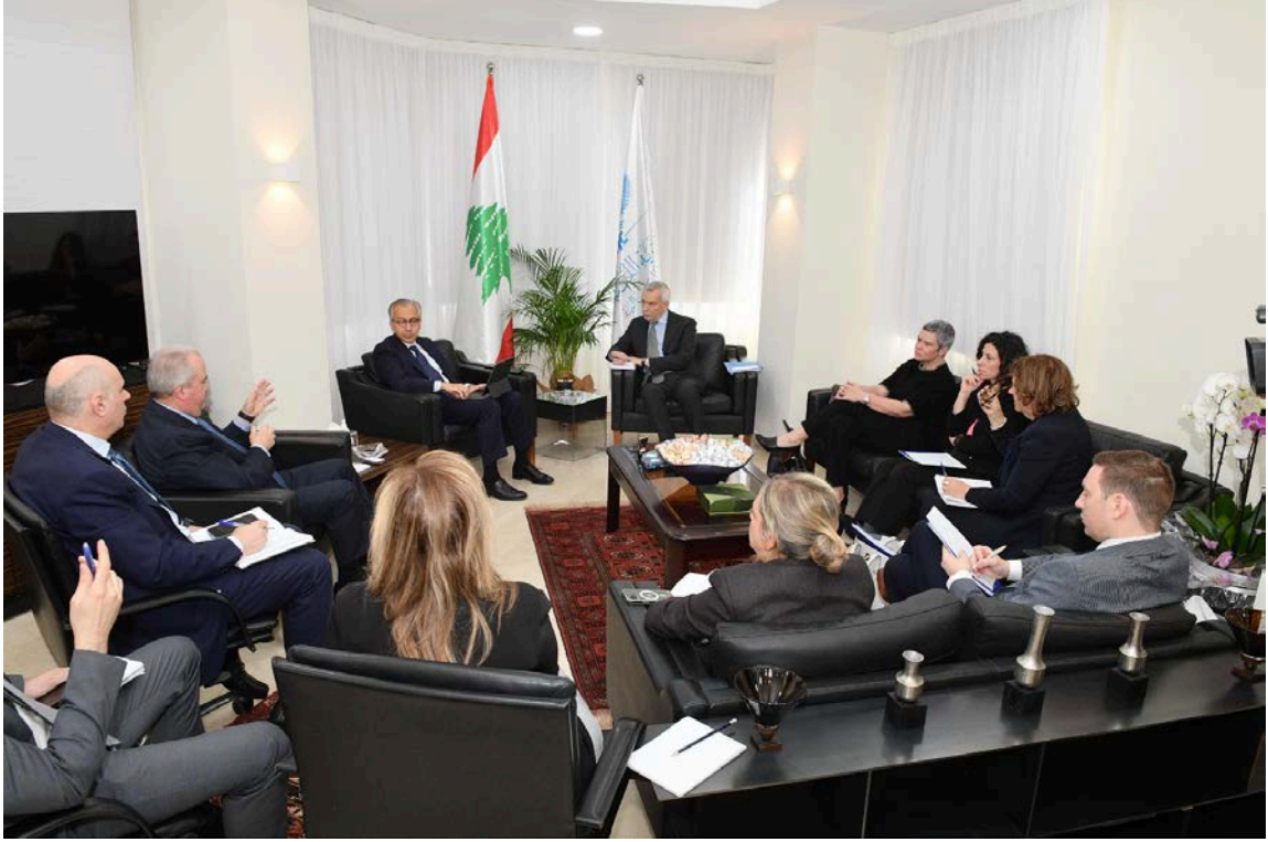
الاجتماع الافتراضي مع صندوق النقد الدولي: